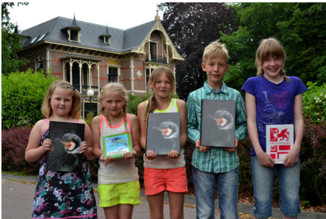
Veur alle leerlingen van et basisonderwies wodde een fotowedstried organiseerd. De opdracht daarveur was om een foto te maeken in et eigen dörp van et, veur de leerling, meest biezondere plak. Op 'e foto de winners van die wedstried.

Op woensdag 25 september wodde de jaarlikse hiemkundemiddag veur et onderwiesend passeniell in Stellingwarf organiseerd. Tiedens die middag wodt et ni'jste lesmateriaol prissentend en is d'r tied veur vraoge en aanbod. Een kleine dattig onderwieskrachten deden an de middag mit.