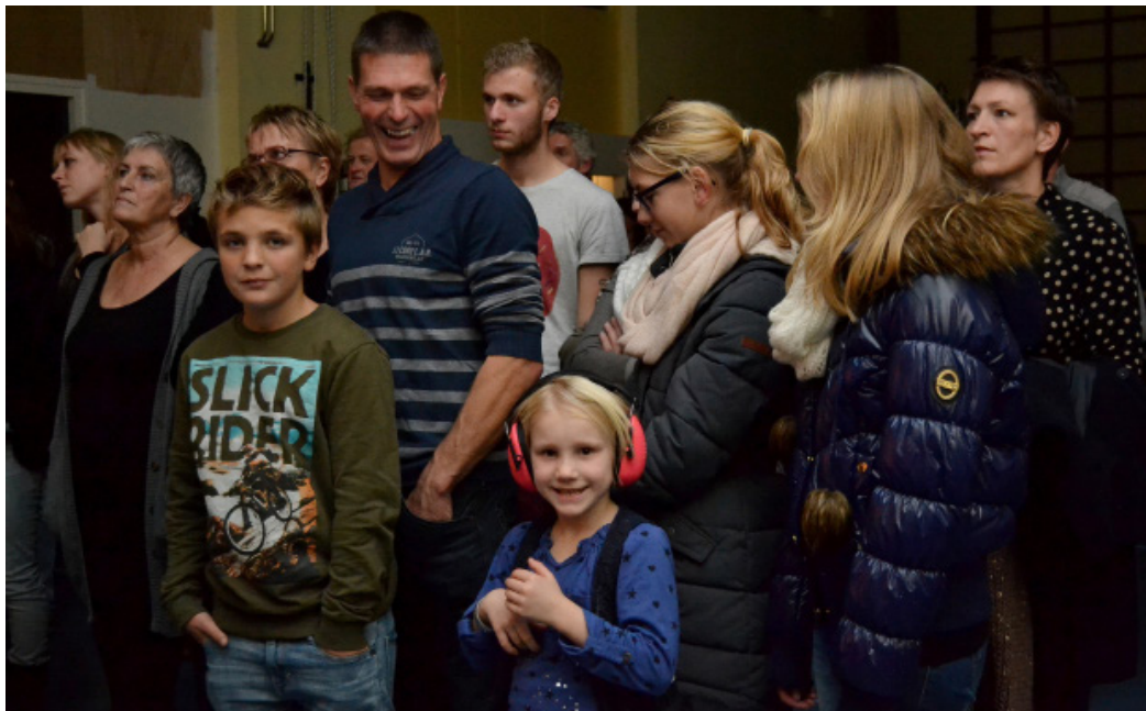
Jong en oold kwam naor Stellingwarfpop 2013.