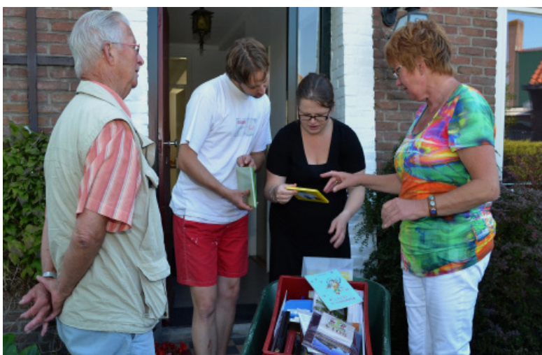
Foto boven: De prissentasie van de beide routegidsen in Wolvege. Foto onder: Veul belangstelling veur de boeken tiedens de sutelaktie.