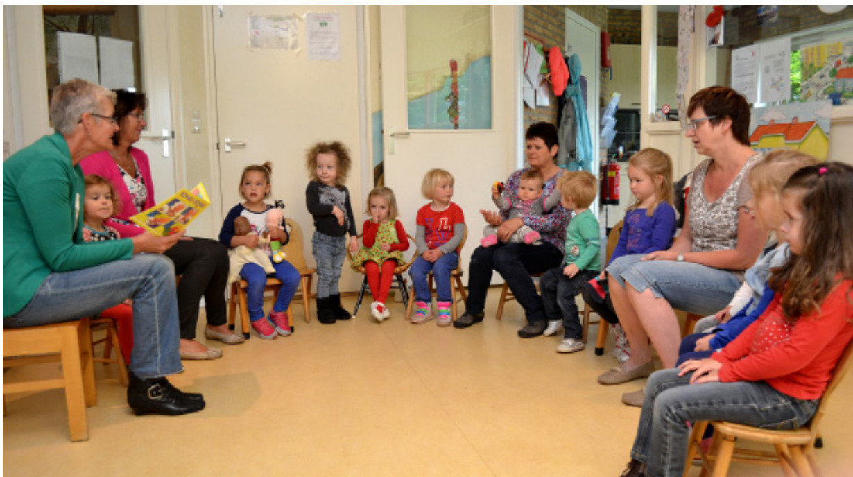
Et veurleesprojekt Tomke wodt alle jaoren in de Stellingwarver ukkespeulplakken hollen. De aktie wodt organiseerd, koördineerd en uitvoerd deur vri'jwilligers.

Omreden de Friese Vertelbus niet meer rieden kan, is Tresoar overgaon naor een aander vertelprojekt, dat is 'De Vertelkoffer'. De Stellingwarver Schrieversronte het him bi'j dit projekt ansleuten.