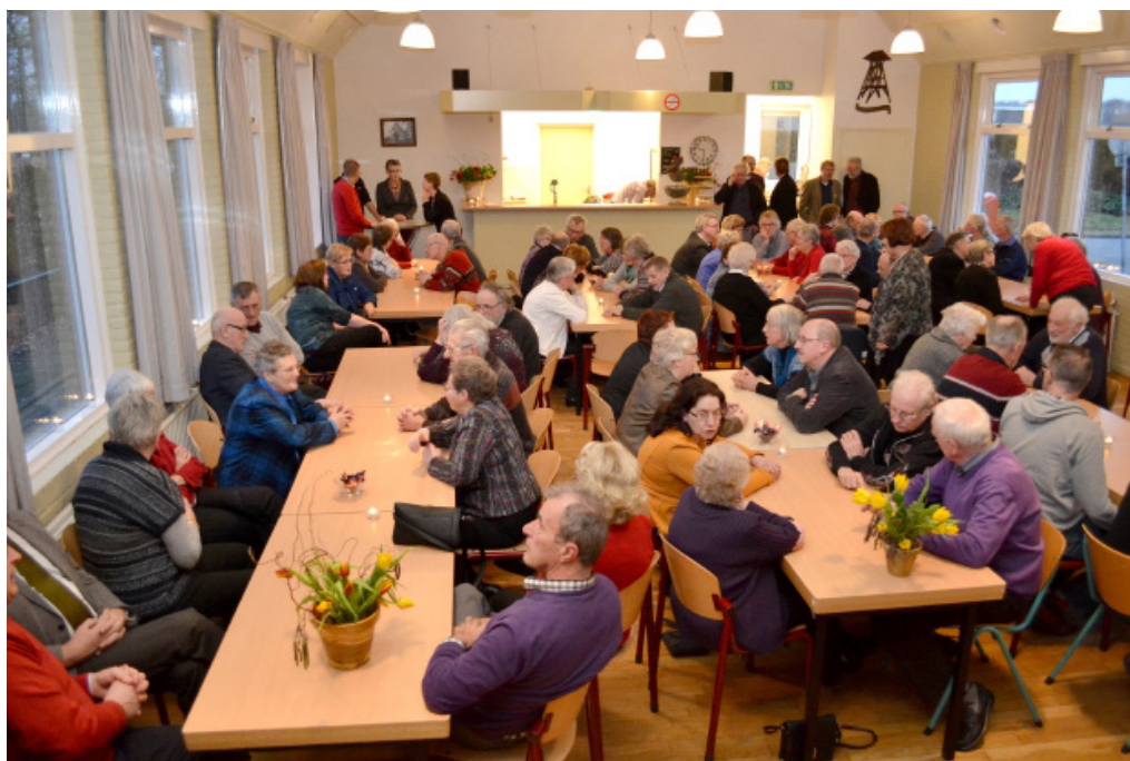
Veur de vri'jwilligers van de Stellingwarver Schrieversronte wodde in feberwaori een speciaole aovend organiseerd in et dörpshuus van Langedieke.

In et jaor 2013 is een veerder vervolg geven an de utbreiding van aktiviteiten en de uitvoering daarvan deur vri'jwilligers. Mit naeme de direkteur het daor in et verslagjaor flink tied an besteded, en mit sukses. Zo is d'r een groep van zes vaaste vri'jwilligers ien dagdeel in de weke bi'j de Schrieversronte an et wark t.b.v. et Kenniscentrum en de webstee stellingia.nl.