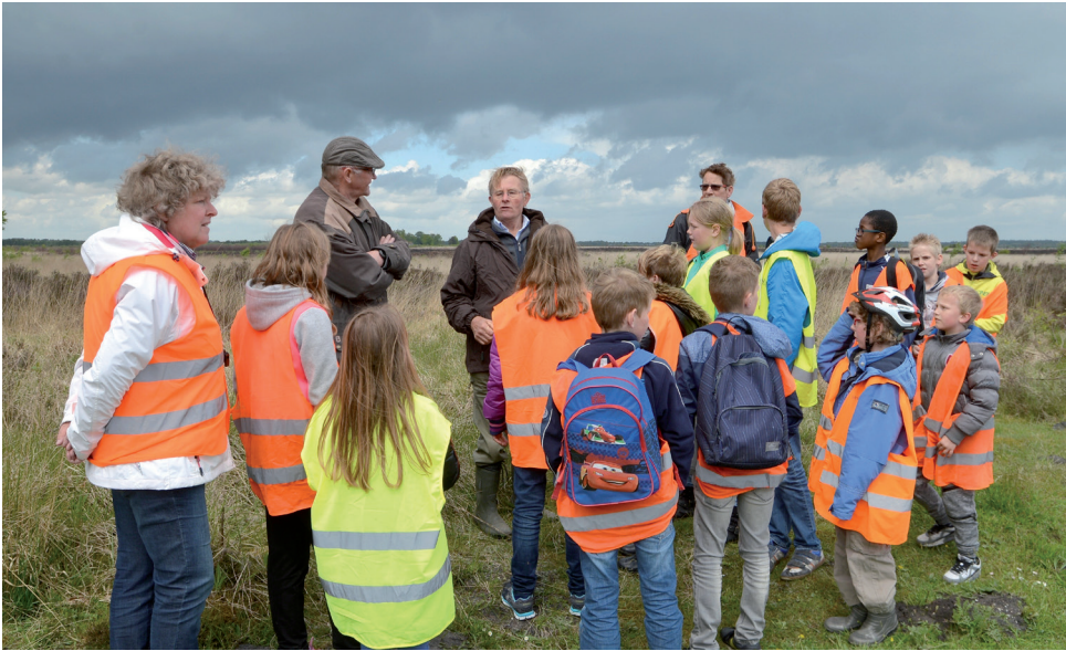
Veur de netuurekursies, die speciaal veur et vak hiemkunde in et basisonderwies ontwikkeld wodden, is de hieltied meer belangstelling.