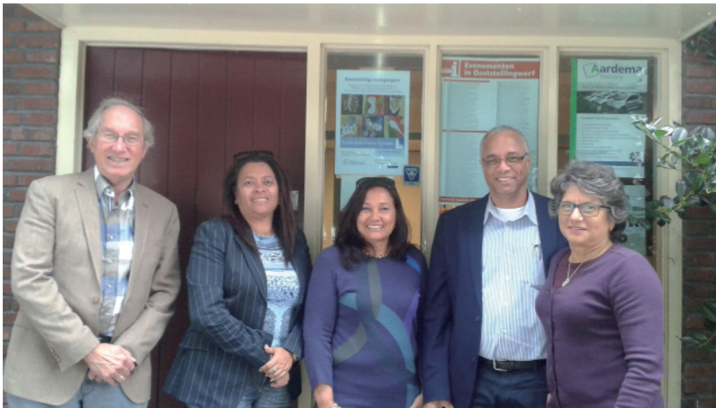
Vanuit Bonaire is d'r veul belangstelling en interesse veur de manier van anpak deur de SSR om de eigen tael en kultuur in levend gebruik te hollen.