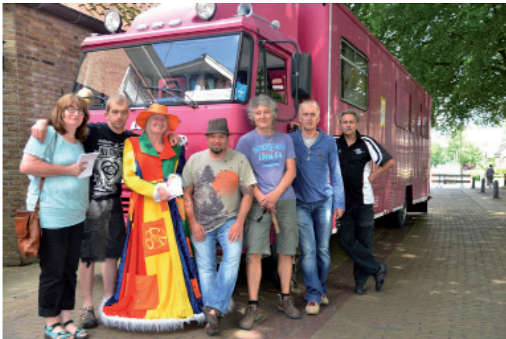
Et permosieteam van et Stellingwarfs Meziekfestival komt in Berkoop an.