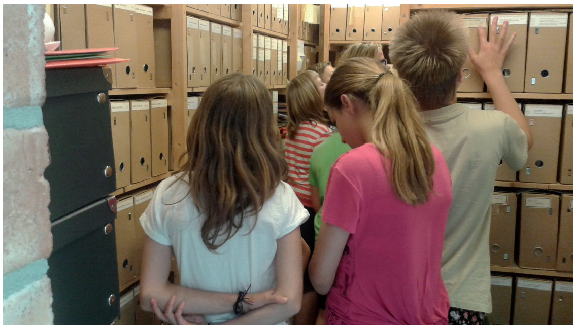
Leerlingen van o.e. de basisschoole van De Haule weren op bezuuk in et Kenniscentrum op zuke naor historische gegevens uut en over heur dörp.