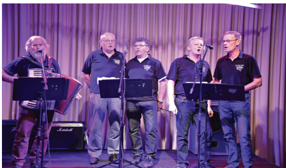
'k Wait nait' winner meziekfestival