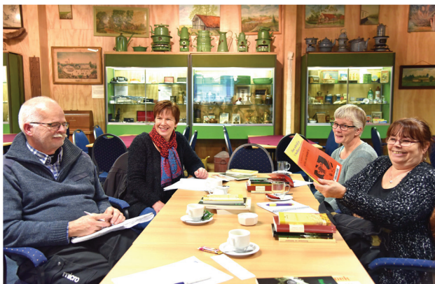
De kursus 'Stellingwarfs veur beginners' gong in november uut aende in Appelsche