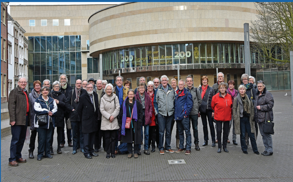
Op uutneudiging van Twiede Kaemerlid Lutz Jacobi gong een grote groep sutelders van de Schrieversronte op deensdag 8 meert naor Den Haag. Daor was veur heur een speciaole rondleiding en daornao vertelde Jacobi over heur wark in Den Haag. De laeste jaoren dot Lutz Jacobi mit an de Stellingwarver sutelaktie

De statutaire naeme ludet in artikel 1 Naeme en zetel: Stichting Stellingwarver Schrieversronte en et vestigingsplak is officieel Oosterwoolde, gemiente Oost-Stellingwarf. De doelstelling in de statuten is vaastelegd in artikel 2. Doel 1. De Stichting stelt zich ten doel het Stellingwerfs als levende streektaal te handhaven en te bevorderen. 2. Zij tracht dit te bereiken door: a. het zelf uitgeven of doen uitgeven dan wel het bevorderen van het verschijnen van publicaties in het Stellingwerfs; b. het bevorderen van het gebruik van het Stellingwerfs als spreek- en schrijftaal in het Stellingwerfer taalgebied; c. het verzamelen, bewaren en ter inzage leggen van publicaties in het Stellingwerfs; d. het organiseren en bevorderen van bijeenkomsten, waarin het Stellingwerfs als voertaal wordt voorgestaan; e. bij te dragen aan de verbreiding van de kennis van en over het Stellingwerfs; f. bij te dragen aan het vastleggen, handhaven, zo mogelijk verlevendigen of doen herleven van oude gebruiken in de Stellingwerfen; g. bij te dragen aan de verbreiding van kennis van de Stellingwerfer geschiedenis en folklore; h. het onderhouden en bevorderen van kontakten met personen, groepen en instellingen, die geacht worden het Stellingwerfs en de uitingen hierin te bevorderen of te willen bevorderen; i. alle andere wettige middelen, welke voor het doel der stichting bevorderlijk kunnen zijn.