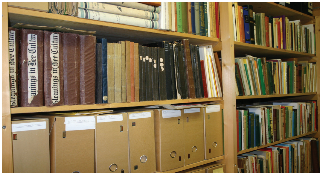
In et Kenniscentrum van de Stellingwarver Schrieversronte wodt een unieke verzaemeling boeken en tidschriften beweerd op et gebied van de iemkeri'je.