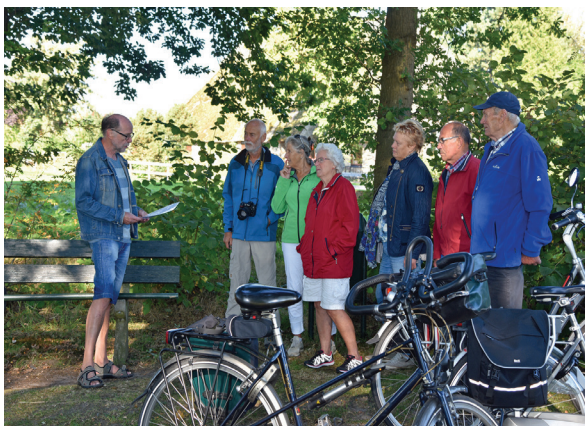
Fietsen en luusteren naor verhaelen