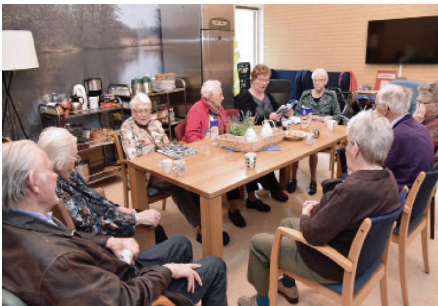
De Stellingwarver veurleesaktie veur oolderen is alle jaoren weer een sukses. De aktie kon dit jaor, deur financiële steun van Stichting Bercoop Fonds veerder uitgebreid wodden

Deur et hiele jaor henne was de Schrieversronte op tal van streekmarken en streekfestivals anwezig mit een info- en/of verkoopkraam, die alle keren bemand wodde deur vri'jwilligers. Tal meensken dat op disse wieze in anraeking komt mit et Stellingwarfs en de Stellingwarver streekkultuur: roem 4000 personen