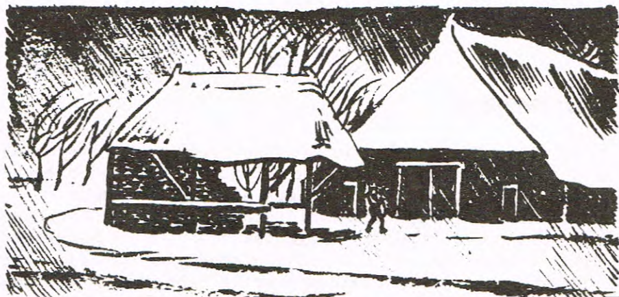
Midden in Drenthe.