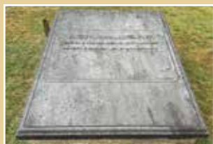
Graf mit een verhael