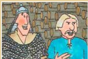
Otto, heer van Buil