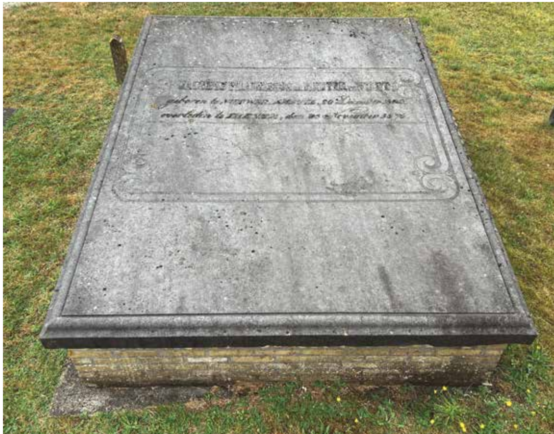
Graf van De Ruyter de Wildt in Buil.

V eur de liefhebbers van de Stellingwarver streekgeschiedenis bin karkhofen in oonze kontreinen vaeke antrekkelike plakken om zomar es wat omme te beinse-len. Somstieden kuj' d'r letterlik veur inter-ressaante bevienings kommen te staon. Zo leup 'k nog niet zo lange leden op 't karkhof van Buil tegen et graf an van een zekere De Ruyter de Wildt, vlakbi'j de klokkestoel mit zien oolde luudklokke van 1399. De dubbele naeme op 'e beheurlike grafstien trok mien andacht. Nao wat onderzuuk dee blieken dat de beroemde Nederlaanse zeeheld admiraal