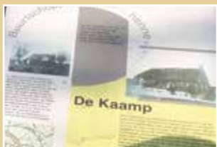
Stellingwarfs in et wild