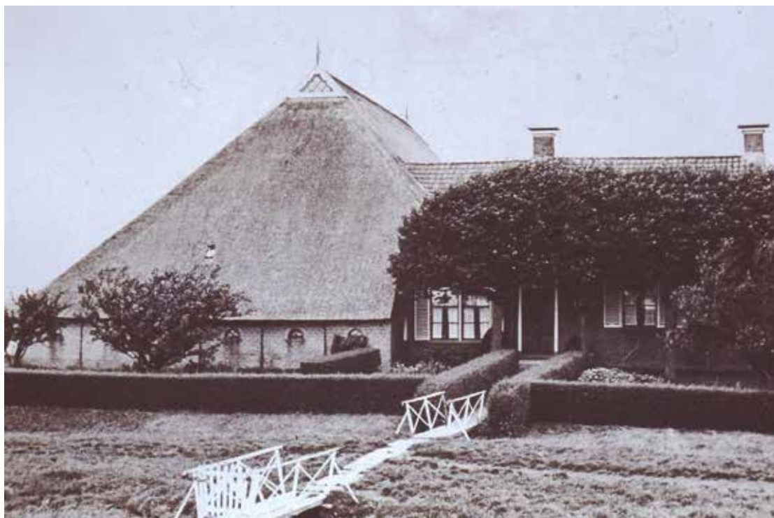
De Blauwhof mit aachter de liendebomen et veurhuus waar rond 1930 de schoelkarke te vienen was.

lingwarf, mar mit dit ni'je boek kuj' ok nog es even wegdromen naor eertieds