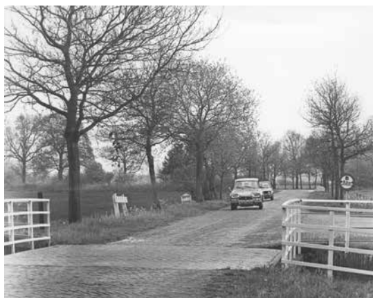
Bekhoftille bi'j de Bekhofschaans tussen Zaandhuizen, Boekelte en Berkoop in 1973.

wodt drokt deur Printbase uut Sunt-Jehan-nesge en is behalven bi'j de uitgevers ok in de boekwinkels van West-Stellingwarf te koop veur € 17,50.